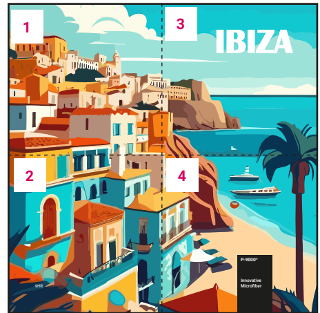
Ansicht des fertigen Universaltuch