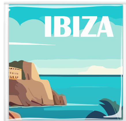
Ansicht im Polybeutel mit sichtbarem Motivausschnitt 3