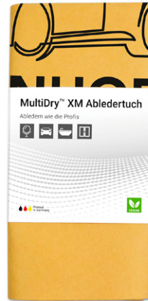
Ansicht der fertigen Banderole

— = Druckfläche ca. 248 x 96 mm inkl. 3 mm Beschnittzugabe