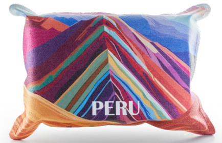
Ansicht des fertigen CarKoser®

• Wir empfehlen diese Angabe aufgrund der Textilkennzeichnungsverordnung.