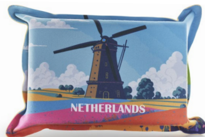
Ansicht des fertigen CarKoser®

• Wir empfehlen diese Angabe aufgrund der Textilkennzeichnungsverordnung.