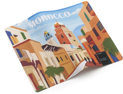
Ansicht des fertigen Displaytuchs