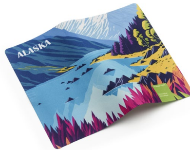
Ansicht des fertigen Displaytuchs