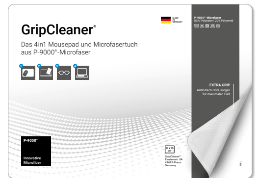
Ansicht der fertigen Einlegekarte