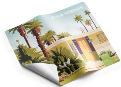
Ansicht des fertigen GripCleaner®