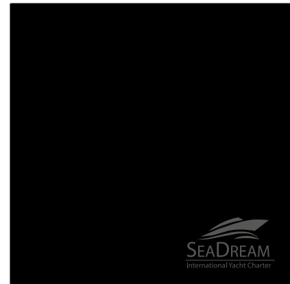
Ansicht des fertigen Prägetuchs mit Saum