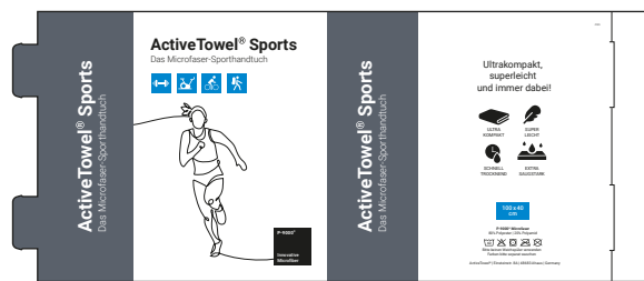
Ansicht des fertigen Schuber Faltschachtels

— = Druckfläche 338 x 146 mm inkl. 3 mm Beschnittzugabe