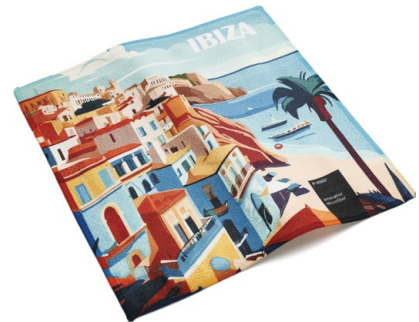
Ansicht des fertigen Universal-Microfasertuchs